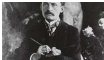
Foto av Munch fra 1902.