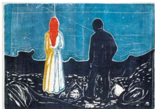
To mennesker / De ensomme, 1899 (tresnitt)